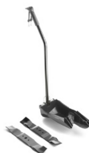
Mulčovací sada (záslepka + nože) pro AT4 84HA 299900370/1