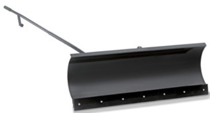
Sněhová radlice pro AT8 102 HWA 299900400/0