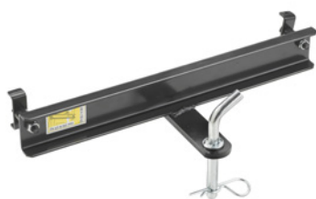
Zadní závěs pro AT4 84HA, AT4 98HA, AT4 98HWA 299900395/0