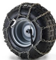
Sněhové řetězy 18" 299900470/1