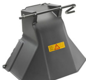
Deflektor pro AT8 102 HWA 299900016/0