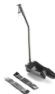
Mulčovací sada (záslepka + nože) pro AT4 98HA, AT4 98HWA 299900374/0