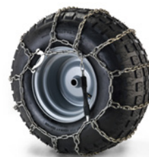
Sněhové řetězy 20" 299900480/1