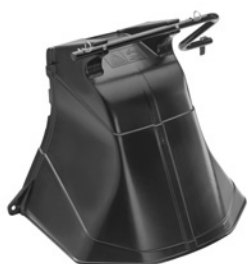
Deflektor pro AT4 84HA, AT4 98HA, AT4 98HWA 299900310/0