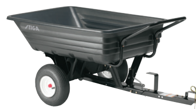
Vozík 180l 13-0952-11