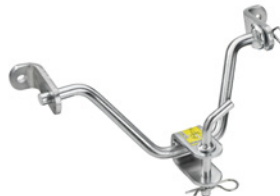
Zadní závěs pro AT8 102HWA 299900006/0