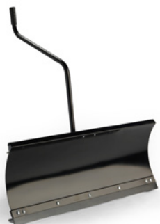
Sněhová radlice pro AT4 84HA, AT4 98HA, AT4 98HWA 299903410/1