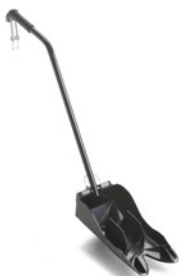
Mulčovací záslepka pro AT8 102HWA 299900055/0